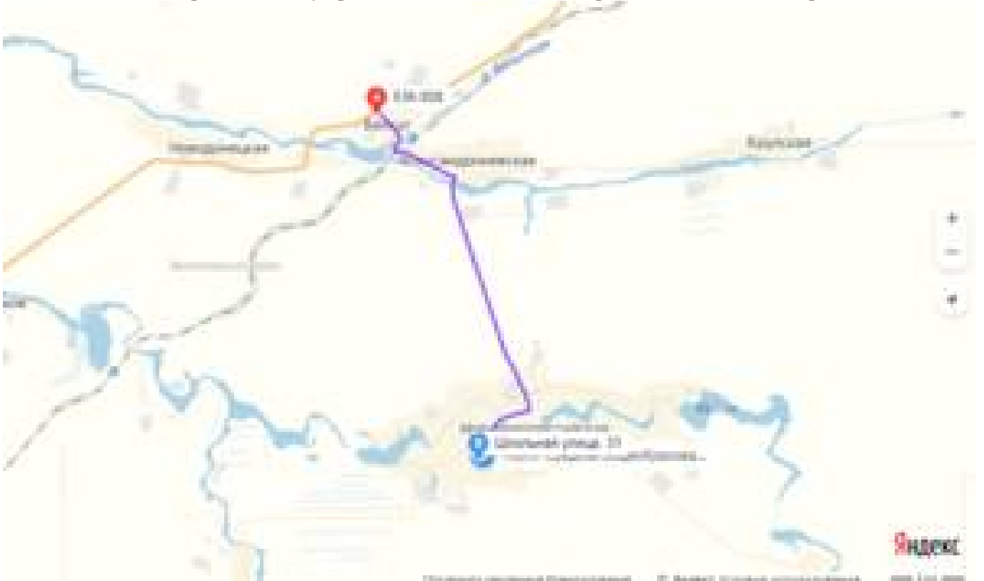
Схема проезда к месту проведения выставки от автотрассы «Выселки – Тихорецк»

Обзорная карта местоположения станции Новомалороссийская