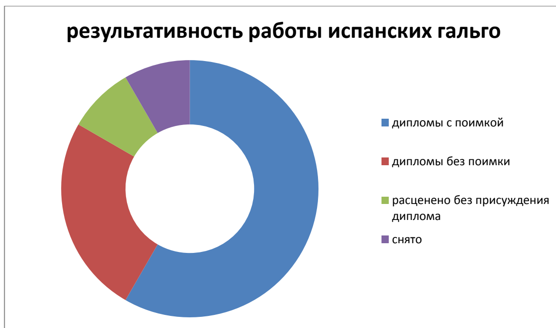
Диаграмма № 2

В состязаниях приняли участие испанские гальго от года до четырёх лет. Из 14-ти испанцев молодых собак до 2-х лет участвовало 2. Самое большое количество борзых в возрастной группе от 2 до 3 лет – их участвовало 6, две трёхлетки и четыре борзые в возрасте от 4 до 5 лет.